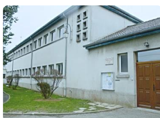
Ecole élémentaire – 25 rue des Cormiers 77690 MONTIGNY SUR LOING - 5 classes du CP au CM2