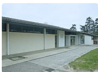
Ecole maternelle – 25 rue des Cormiers 77690 MONTIGNY SUR LOING - 3 classes - Petite section / Moyenne section / Grande section